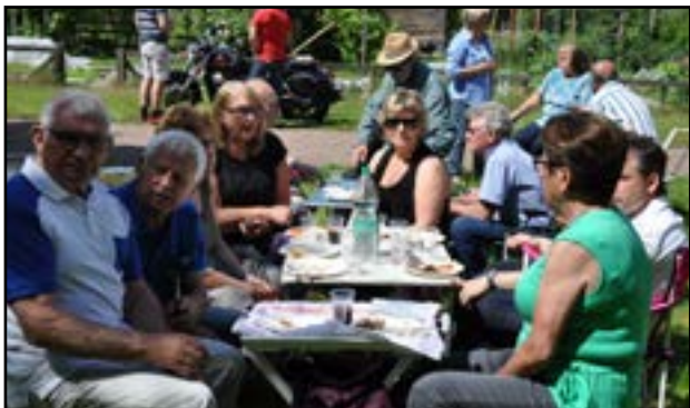
(Fotografije so s piknika Planike 2017)

03. junij 2017. Potovanje – romanje v Vadsteno. Zbrali smo se zgodaj zjutraj ob 6.30 na bencinskem servisu Rosengård, kjer nas je že čakal pravi pravcati dvonadstropni avtobus. Zadnja leta smo se namreč vozili z minibusi in osebnimi avtomobili, tokrat pa je bila v Vadsteni tudi birma in celo krst, zato nas je bilo toliko več. Iz Malmöja je bilo kar šest birmancev. Skupaj s starši, botri in drugimi romarji nas je bilo kakšnih 30. Vremenarjem, ki so za ta dan napovedovali veter in dež, nismo verjeli, ker je na Rosengårdu sijalo sonce. Vendar se tega dne pravzaprav niso zmotili. Ko smo prispeli v Helsingborg, se je pooblačilo, v Smålandu deževalo, v Vadsteni pa kar lilo. Tako je bilo vse do 16. ure. Dež seveda slovesnosti ni mogel zmotiti, vse je minilo kot je treba, veseli in utrujeni smo se vrnili domov.